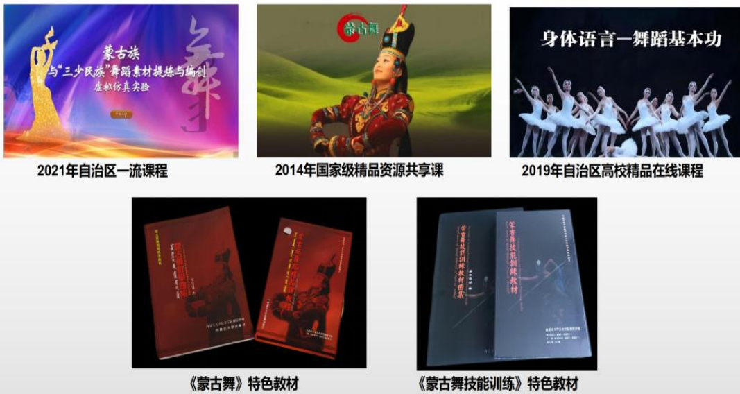
图2 一流课程与特色教材

专业为本： 依托独具特色的民族文化与地缘优势，深化教育教学改革，以地域性、文化性、创新性为基础，将蒙古舞与舞蹈基本功课程融合，促进专业建设，舞蹈表演、编导和音乐表演专业获批国家级一流本科专业建设点。