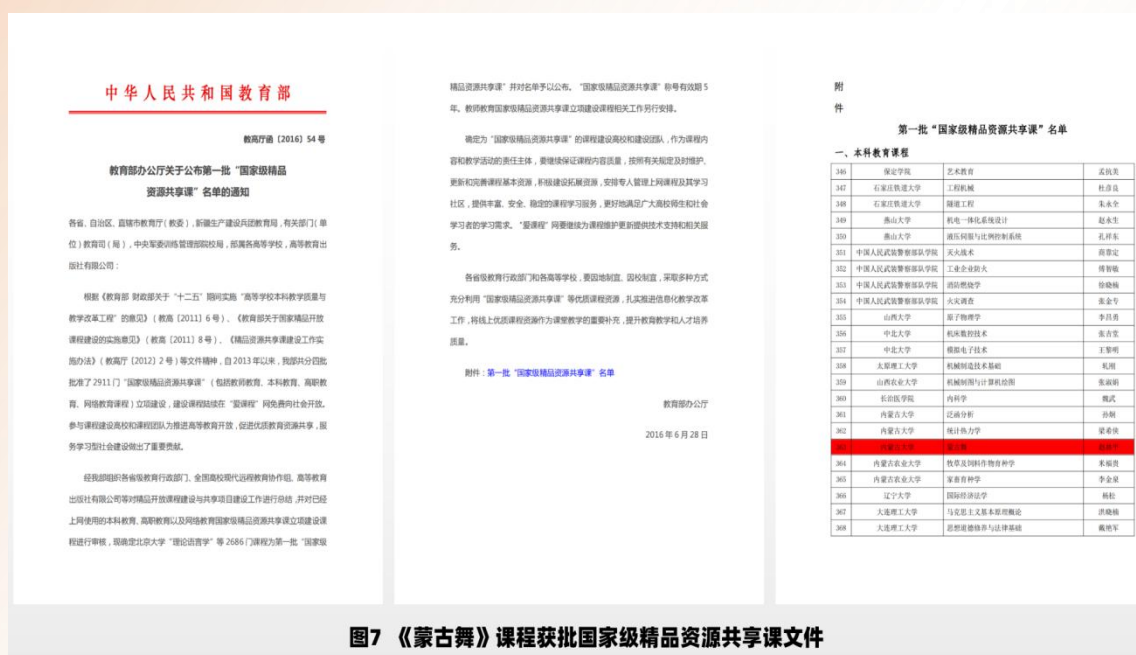
图7 《蒙古舞》课程获批国家级精品资源共享课文件

学习 1052 人；2021《蒙古族与三少数民族舞蹈素材提炼及编创虚拟仿真》获批自治区一流课，ilab 平台实验人次 14744 次。