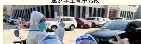
奋战在抗疫一线的老师