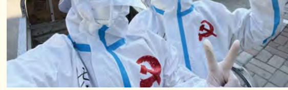
奋战在抗疫一线的老师