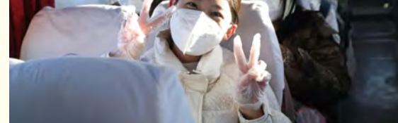
我校送包头学生返乡