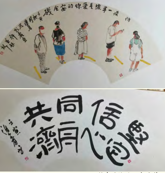
荆建设绘画、书法作品