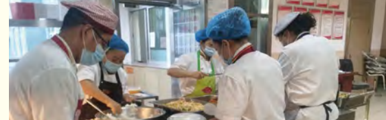
餐饮服务中心为学生打包盒饭