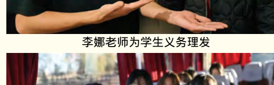
奋战在抗疫一线的老师