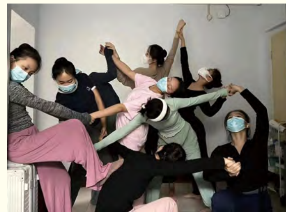
舞蹈学院学生即兴创作