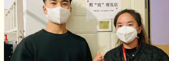
返乡学生有序离校