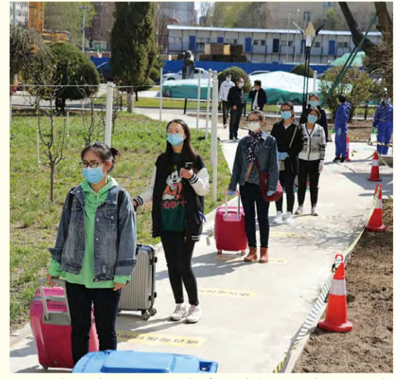
我校举行2020年春季开学复课疫情防控应急处置全要素演练

4月8日上午,内蒙古自治区政府副主席郑宏范在自治区教育厅党组成员、副厅长长成涛的陪同下,深入我校实地督查指导疫情防控和新学期开学准备工作。我校党委书记刘前贵、校长黄海、党委副书记赵海忠、副校长蔡广志陪同督查。 郑宏范副主席对我校落实新冠肺炎疫情防控及开学准备工作给予了肯定,并对下一步工作提出了要求。他强调,在新冠肺炎疫情防控工作中,内蒙古艺术学院认真贯彻落实上级部署和要求,做了大量的工作。下一步工作中,要继续深入贯彻落实习近平总书记关于统筹推进疫情防控和经济社会发展工作的重要讲话、重要指示精神,认真按照党中央、自治区党委政府有关部署要求,细化完善各类工作预案,做好各项应急准备,落实落细防控措施,精心做好学校疫情防控和开学前各项准备工作,切实保障好广大师生的身体健康和生命安全。 我校领导表示,坚决落实党中央国务院决策部署,严格按照自治区党委政府有关要求,强化疫情防控各项措施,把关键环节,加强联防联控,全力做好学校新冠肺炎疫情防控及复学各项准备工作。