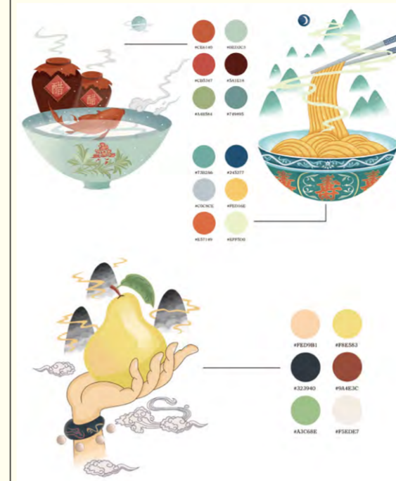
晋·总(插画设计) 柴文娟

本次毕业作品展以线上形式进行，共展出视觉传达设计方向、环境设计方向13位硕士研究生的280余幅设计作品。在学位点导师们的辛勤指导下，研究生们从中国传统文化、民族与地域文化中汲取养分，立足实践，创作出题材多样、主题鲜明、富有时代气息的设计作品。从作品的选题内容及表现形式上可以看出，学生们对解决问题途径的积极探索，对社会与自然环境以及民生问题的密切关注。作品既注重对传统文化的传承，又能与现代生活同构，饱含着学生们潜心研究、积极探索、勇于实践的学术精神。