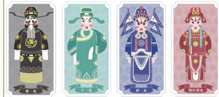
河北梆子人物形象文创设计 贾兴宇