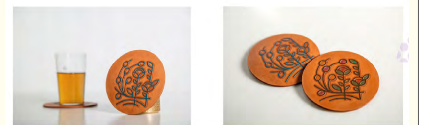
和恩琪迹(品牌文创产品设计实践 纪念品系列产品) 高汀