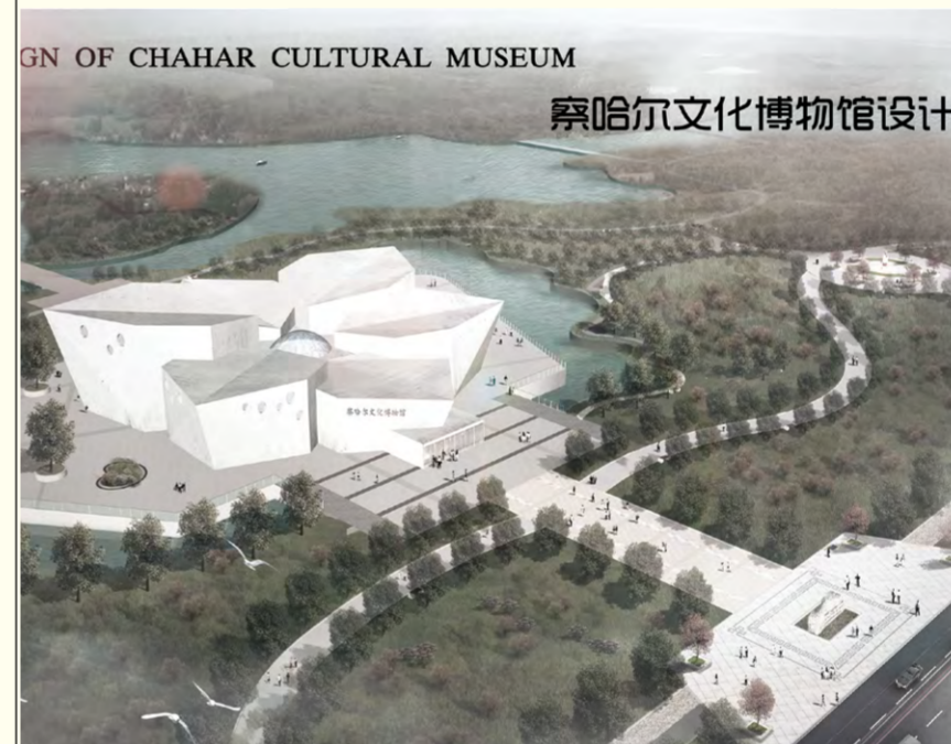
察哈尔文化博物馆 陶拉