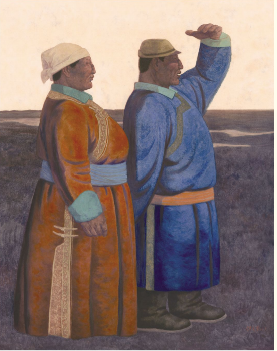
荣获第三届“中国美术奖”金奖作品:《远方》(水彩画)